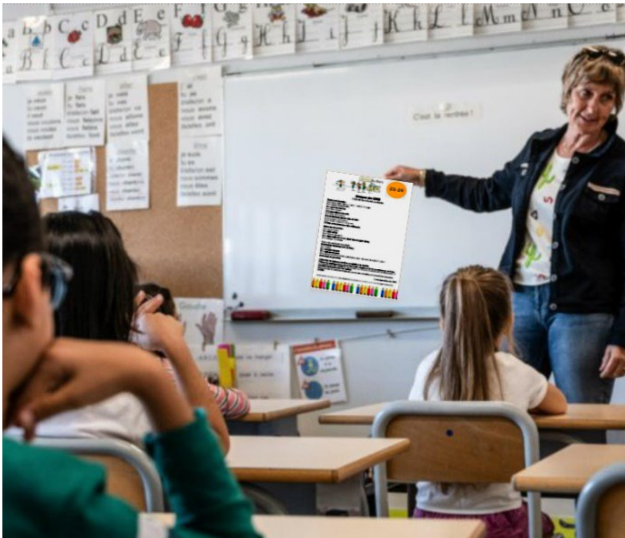
© Xavier Leoty, AFP, modifié par Tan Tieu